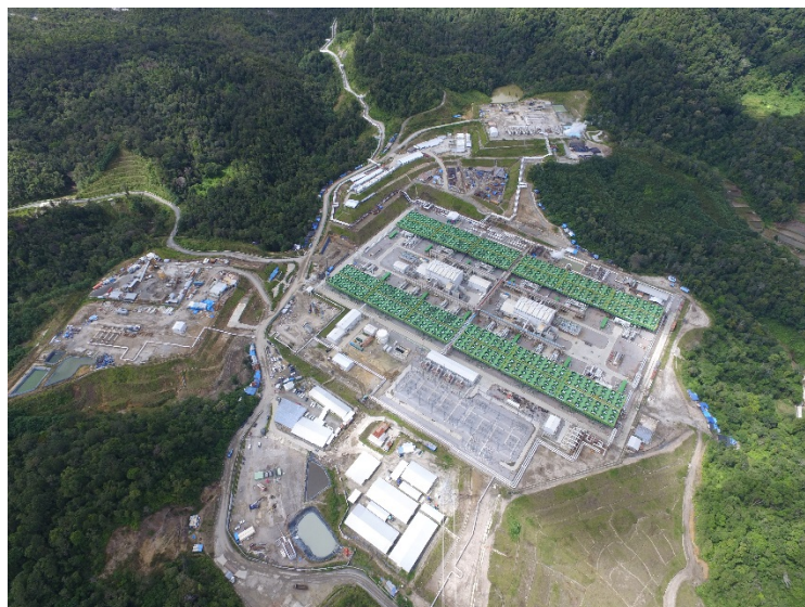
商業運転の様子（第 2 号機及び第 3 号機）